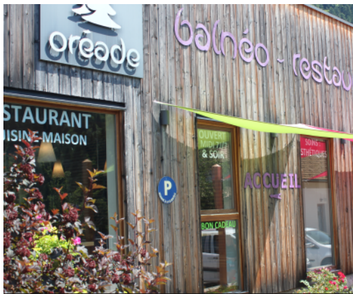
Un restaurant diététique de qualité