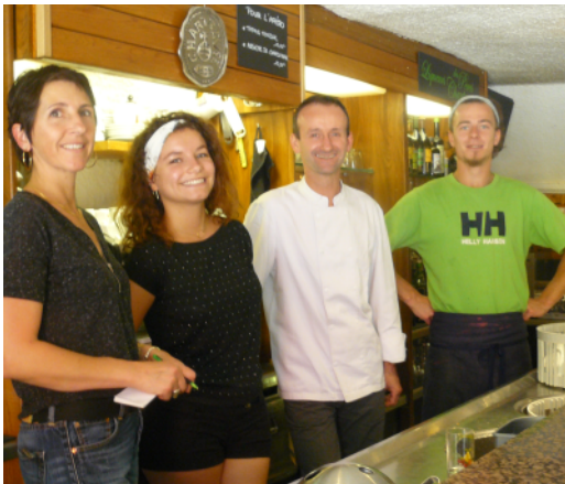
L'équipe sera heureuse de vous accueillir